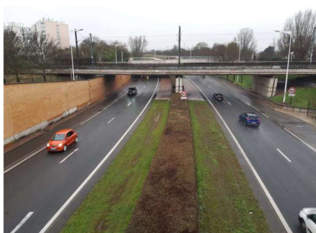
Il est actuellement impossible de récupérer la deux fois deux voies depuis la zone d'activité des Alouettes.

L'Association de riverains des rues Burgué et Chopin (ARBC), créée à l'origine pour protester contre le projet d'une grosse école, réclame donc une nouvelle bretelle d'accès au BIP, la D170 qui relie pour l'instant Argenteuil à Soisy-sous-Mont-